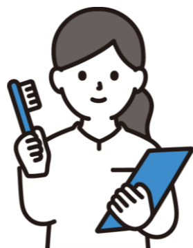
Bさん 歯科衛生士 勤務経験12年 訪問経験8年 ※歯科医院常勤3年 週1回パート5年

義父の介護・子育ての中でできた時間で訪問の歯科衛生士として復職しました。診療室勤務よりも時間の調整ができて働きやすく、在宅や施設で色々な職種の方との関わることはとても勉強になります。『食べる』を支えるために良い刺激を受けながら、チームで関わることを嬉しく思っています。