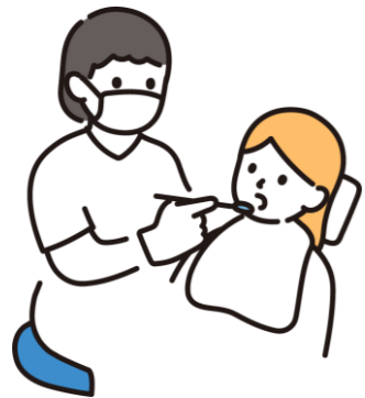
Aさん 20代 歯科衛生士 勤務経験6年 訪問経験3年